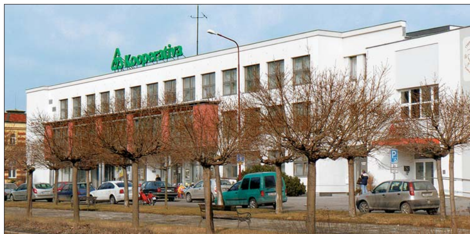
Město odprodalo třetinu budovy zpět Kooperativě za 3,5 milionu korun.