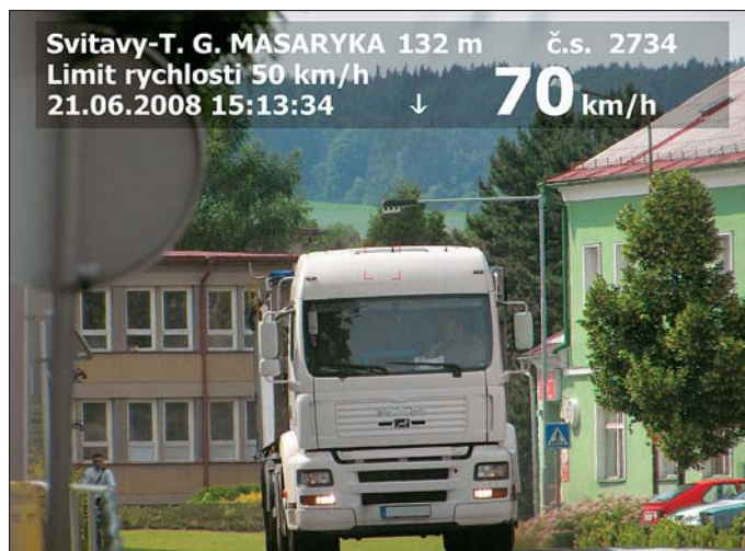
Městská policie měřením přispívá k bezpečnosti ve městě.