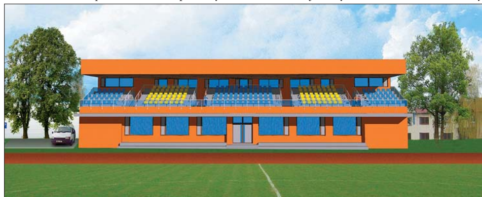
V první etapě bude také postaven nový dvoupodlažní objekt na místě stávající staré tribuny.