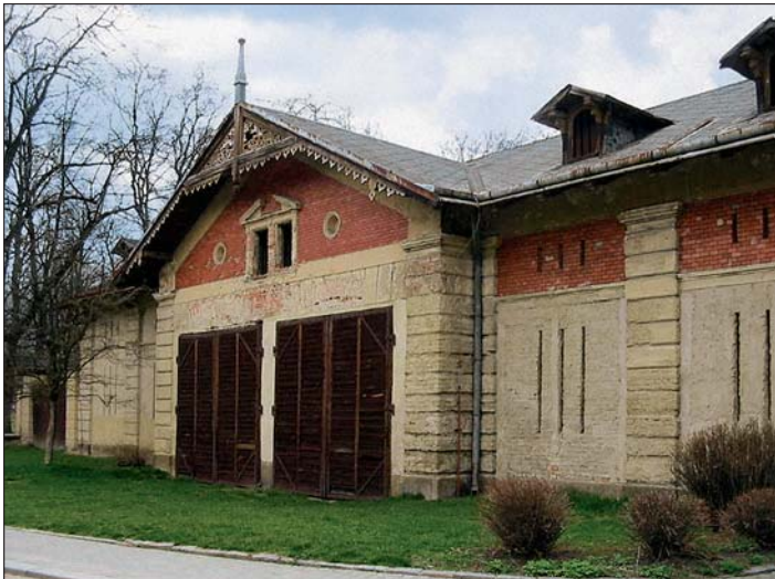
Budova stodoly před rekonstrukcí.

Další z projektů města, na které velkou měrou finančně přispěla Evropská unie (předpokládaná částka čerpání dotace je 8,7 mil. Kč bez DPH), začne sloužit svitavským občanům. Svým umístěním na okraji malebného parku má ambice se stát místem jejich častých setkávání.