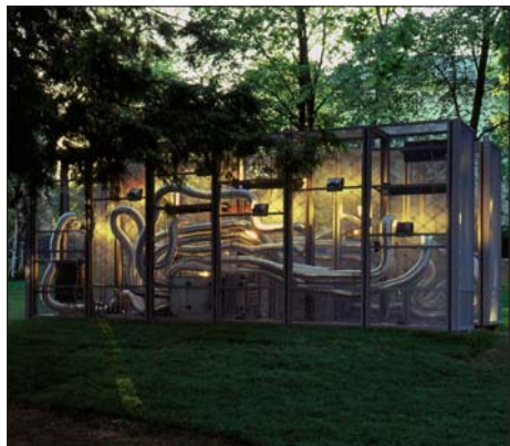
Památník bojovníkům a obětem za svobodu vlasti v Liberci.