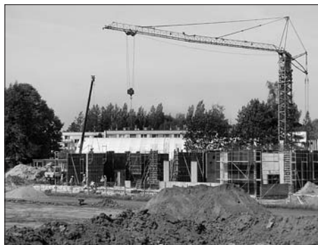
Místo fotbalového hřiště a atletické dráhy je jedno velké staveniště.

Plánovaná rekonstrukce fotbalového hřiště a atletické dráhy na stadionu Míru byla zahájena 30. července 2009. Investorem těchto akcí je Tělovýchovná jednota Svitavy. Rekonstrukce fotbalového hřiště je hrazena z programu Ministerstva mládeže, školství a tělovýchovy ČR (5 mil. Kč), rekonstrukce atletické dráhy je hrazena z programu Ministerstva financí ČR (8. mil. Kč) za finanční spoluúčasti města Svitavy (3,6 mil. Kč). Celková hodnota prací v roce 2009 je tedy 16,6 mil. Veškeré stavební práce budou ukončeny nejpozději do 30. října 2009. Na stadionu bude zcela nově založený trávnik na fotbalovém hřišti s umělým zavlažováním, tartanová dráha a podklady na sektorech budou připraveny pro položení tartanu.