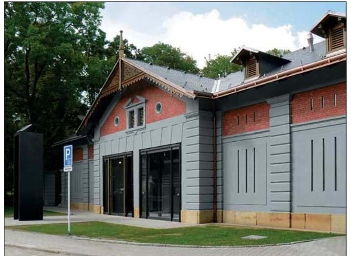
Současný stav budovy před otevřením.