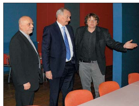
Přemysl Sobotka procházel celou Fabrikou s velkým zaujetím, ocenil její funkčnost a kvalitní stavební detaily. Nejvíce se mu líbil multifunkční sál, knihovna a příjemný interiér restaurace.