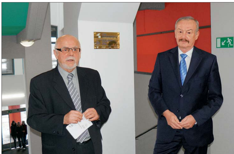
Starosta Jiří Brýdl a předseda Senátu Přemysl Sobotka při slavnostním projevu.

Multifunkční a kulturní centrum Fabrika jsme v loňském roce přihlásili do architektonické soutěže Stavba roku 2009 .