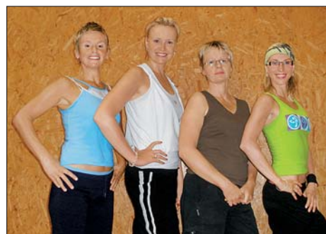
Cvičitelky Aerobik klubu Svitavy.

Zveme všechny příznivce sportu na naše pravidelné hodiny: úterky jsou věnovány formám aerobiku a step aerobiku, čtvrtky ZUMBĚ. Se začátkem školního