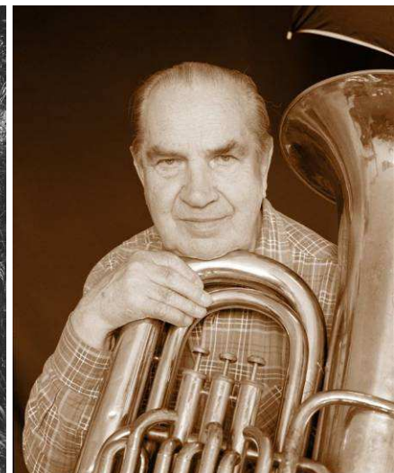
Autoportrét s tubou - asi 80. léta