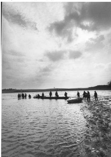
Výlov rybníka Hvězda v Opatově - 80. léta